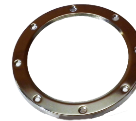
Låsering. / Låsring