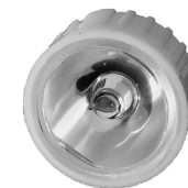
Reflektor til diode. Reflektor till diod.