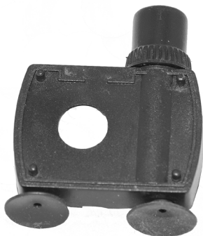
Rotorlåg / Rotorlock