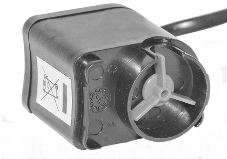
Pumpedel med rotor Pumpedel med rotor