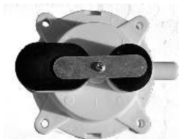
Membrankammer AN3000 / Luftkammare AN3000 Artnr. 30635