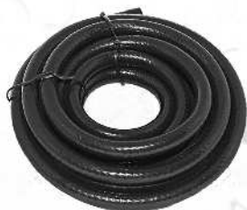
Sort luftslange artnr. 50545 (9 mm x 100 m) Svart luftslang artnr. 50545 (9mm x 100 m)