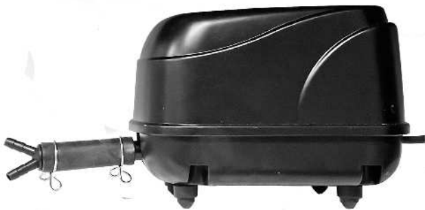
Luftpumpe model AN3000 og AN4200 med dobbelt luftudgang. Luftpump modell AN3000 och AN4200 med två luftutgångar.