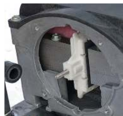
Aksel til membranholder. / Membranhållarens axel.