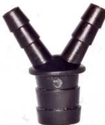
Slangestuds til model AN3000 og AN4200 Slangkoppling till modell AN3000 och AN4200