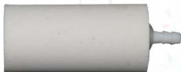
Luftsten stor hvid art.nr. 30650 Stor cylinderformad luftsten artnr. 30650