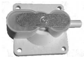
Membrankammer AN1680 / Luftkammare AN1680 Artnr. 30635