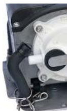
Indre luftslange afmonteres. / Luftslangen i luftkammaren monteras bort.