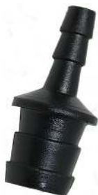
Slangestuds til model AN1680 Slangkoppling till modell AN1680