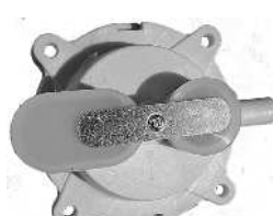
Membrankammer AN4200 / Luftkammare AN4200 Artnr. 30637