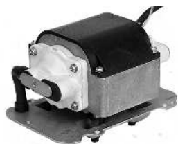
Pumpeblok med firkantet membrankammer. / Pumpblock med fyrkantig luftkammare.