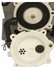
Membrankammers dæksel tages af. / Luftkammarens lock monteras bort.