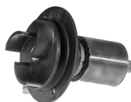
Rotor Artnr. 30793