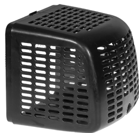
Bageste filterkammer / Bakra filterkåpa