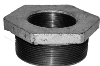
Reduktionsring / Gängad reduceringssockel