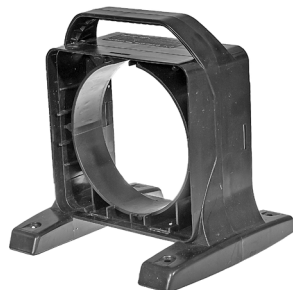
Håndtag / Handtag