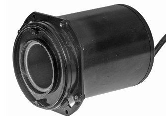
Pumpemotor (Stator) / Pumphus (Stator)