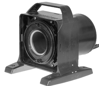
Pumpe med afmonteret rotor / Pumphus utan rotor