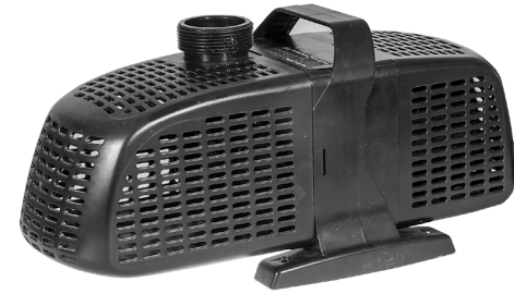
Komplet pumpe / Komplet pump

En defekt pumpe må ikke lægges i den normale dagrenovation, men skal indleveres på en af hjemkommunens genbrugspladser for el-materiel, f.eks. en miljøstation.