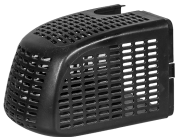
Forreste filterkammer / Främre filterkåpa