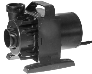
Pumpe uden filterdæksler / Pumphus helt utan filterkåpor