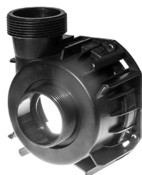
Rotorlåg / Rotorlock