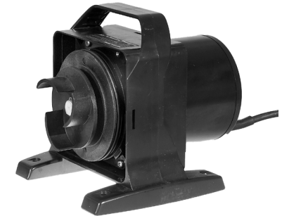
Pumpe med afmonteret rotordæksel / Pumphus där rotorlocket är bortmonterat