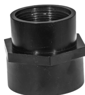
Reduktionsmuffe / Reduceringssockel inv-inv