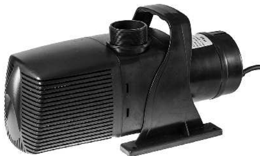
SuperJet Pro - komplet / SuperJet Pro - komplett