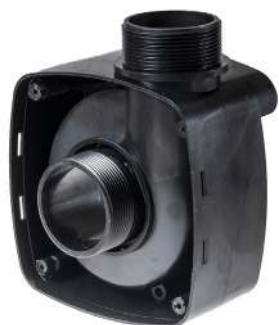
Rotorlåg / Rotorlock