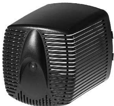
Filterhus / Filterkåpa