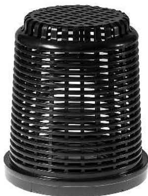
Filterindsats / Filterinsats