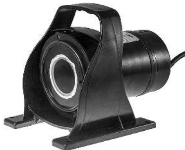
Pumpemotor med rotorbrønd / Pumphus med tom rotorbrunn.