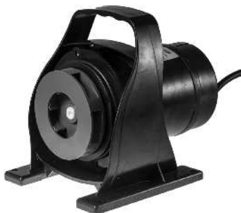
Pumpemotor med rotor monteret / Pumphus med rotor i rotorbrunnen.