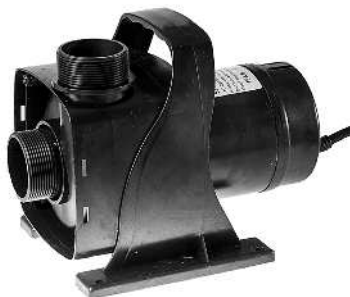
SuperJet Pro med afmonteret filterhus og filterindsats / SuperJet Pro med filterkåpe og filterindsats, bortmonterede.