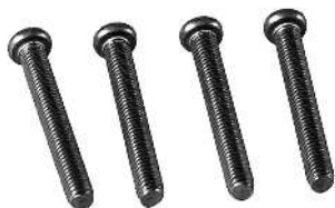
Skruer til rotorlåg / Skruvar till rotorlock