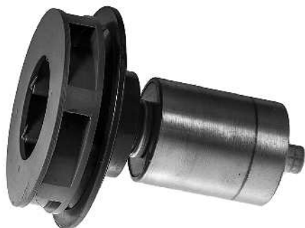
Rotor Modell 26000 Artnr. 30772 Modell 33000 Artnr. 30773