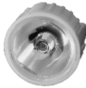
Reflektor til diode. Reflektor till diod.