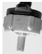
Dryp mundstykke / Droppmunstycke