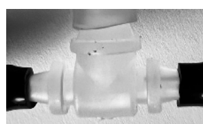
T-stykke transperant med klar og sort slang / T-stykke transparent med svart och klar slang