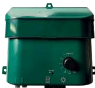
Vandingsmodul / Bevattningsmodul