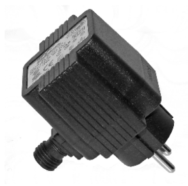
Udendørs transformator Uttomhus transformator