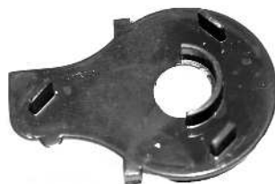
Rotorlåg / Rotorlock