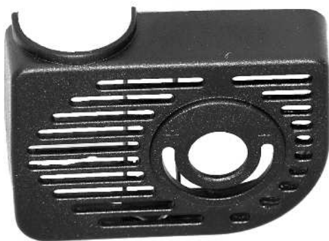
Filterhus / Filterkåpa

En defekt pumpe må ikke lægges i den normale dagrenovation, men skal indleveres på en af hjemkommunens genbrugspladser for el-materiel f.eks. en miljøstation.