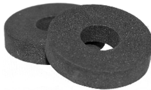
Tætningsringe Tättningsringar Artnr. 30920

Slangen finns inte som reservdel - levereras endast tillsammans med pumpen.